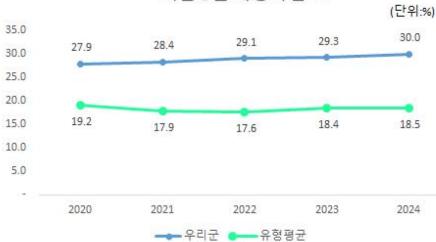
최근 5년 재정자립도

우리군의 재정자립도는 자체세입과 이전재원 증액으로 최근 증가 추세이며 동일 지자체 유형 평균에 비해서는 높은 편입니다.